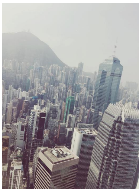
香港金融管理局 55F 俯瞰香港

跟随着负责人小姐姐一起参观了自己旅游都不会去到的香港金融管理局，在经受了 55 楼的高原反应之后，映入眼帘的是俯瞰高楼林立的香港，转身还有琳琅满目的各年代香港货币。讲解员用比较普通的普通话细心的讲解着香港的货币历史。我们被香港钱币上花花绿绿的纹路和图案深深吸引着。